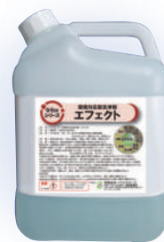
経口急性毒性推定値（ATE値）